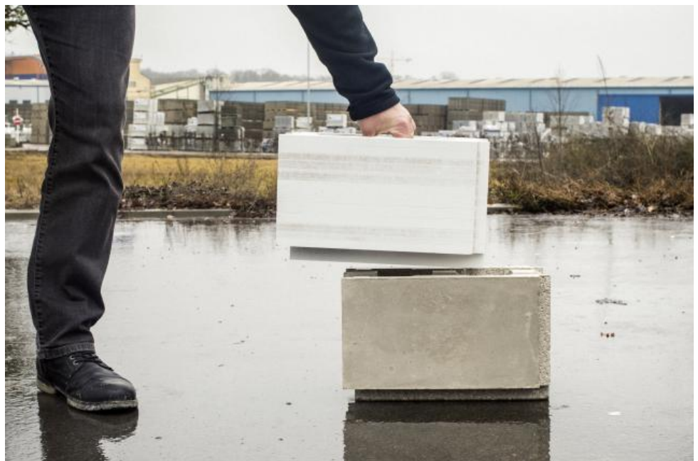
Les M-Blocs, développés par Chaux de Contern, s'emboîtent sans mortier. Leur démontage ultérieur est ainsi facilité.

Il y a ceux qui ne vendent plus de pneus, mais des kilomètres parcourus (Michelin); plus d'ascenseurs, mais des solutions de transport vertical (Mitsubishi); plus de lampes, mais des solutions d'éclairage (Philips); plus de lave-linge, mais des cycles de lavage (Miele)... Les exemples se déclineront peut-être bientôt à l'infini en matière de «produit en tant que service», ce qui constitue un des principes directeurs de